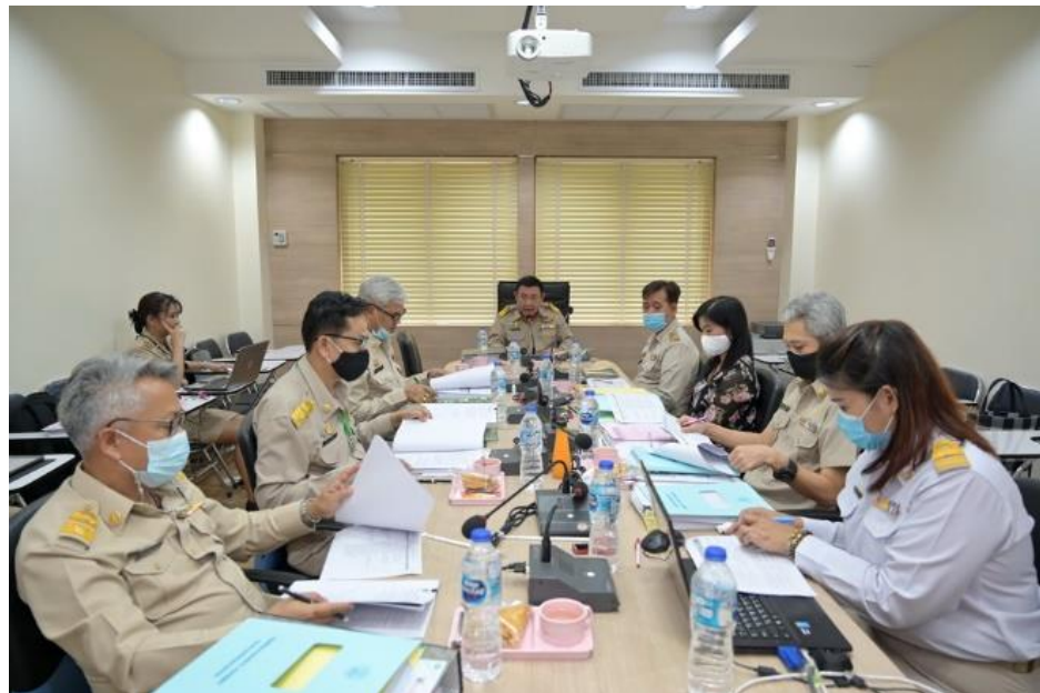
การประชุมคณะกรรมการประเมินผลงานรางวัลคุณภาพกรมปศุสัตว์ ประจำปี พ.ศ. 2564 ครั้งที่ 1/2564 เมื่อวันที่ 8 กุมภาพันธ์ 2564

ส่วนภูมิภาค (สำนักงานปศุสัตว์จังหวัด/ศูนย์) 19 หน่วยงาน จำนวน 22 ผลงาน