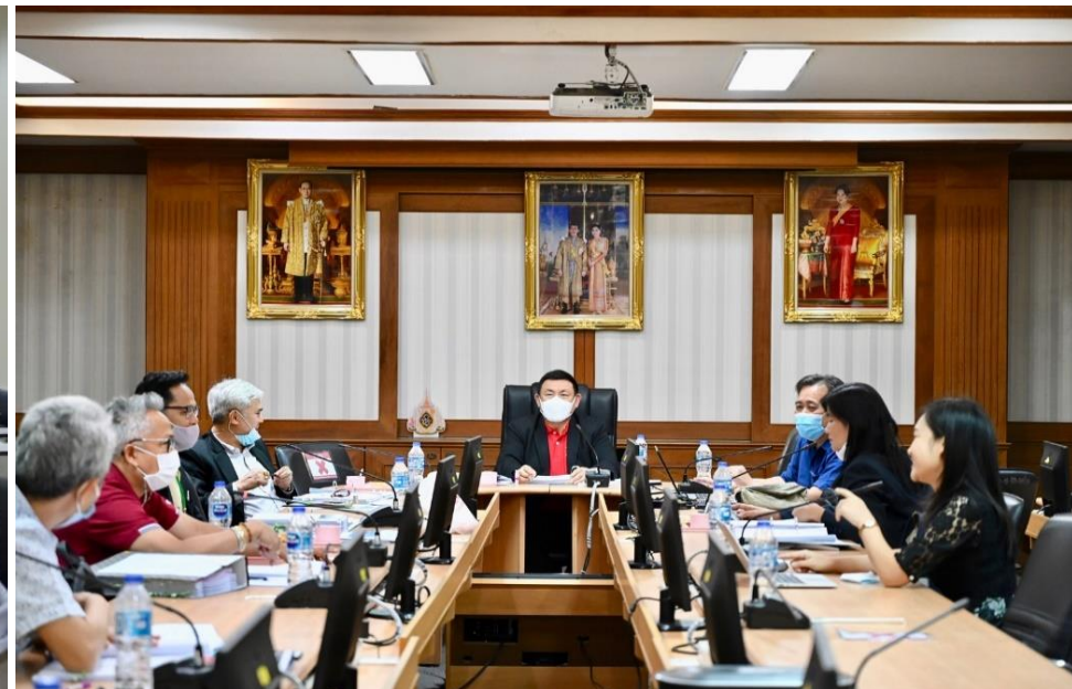
การประชุมคณะกรรมการประเมินผลงานรางวัลคุณภาพกรมปศุสัตว์ ประจำปี พ.ศ. 2564 ครั้งที่ 2/2564 เมื่อวันที่ 11 กุมภาพันธ์ 2564